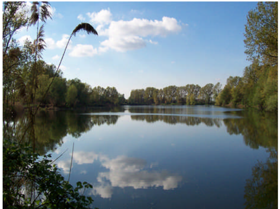
Il lago Mulino di Cusico