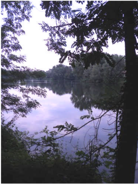
Il Lago Mulino di Cusico