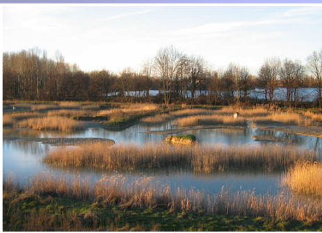
Area umida presso la cava San Novo