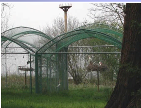
Cicogne a San Pietro Cusico