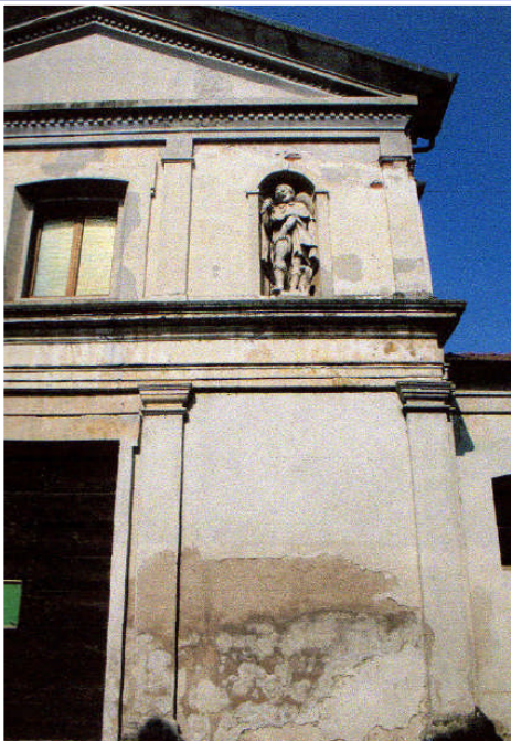
Il degrado sulla facciata della chiesa